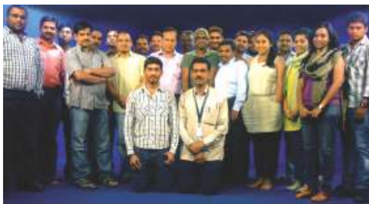
One day training session on soft skills at Panjagutta Office