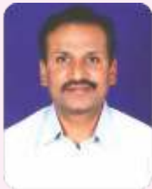
N.V.Ravi Prasad Commercial & Scheduling