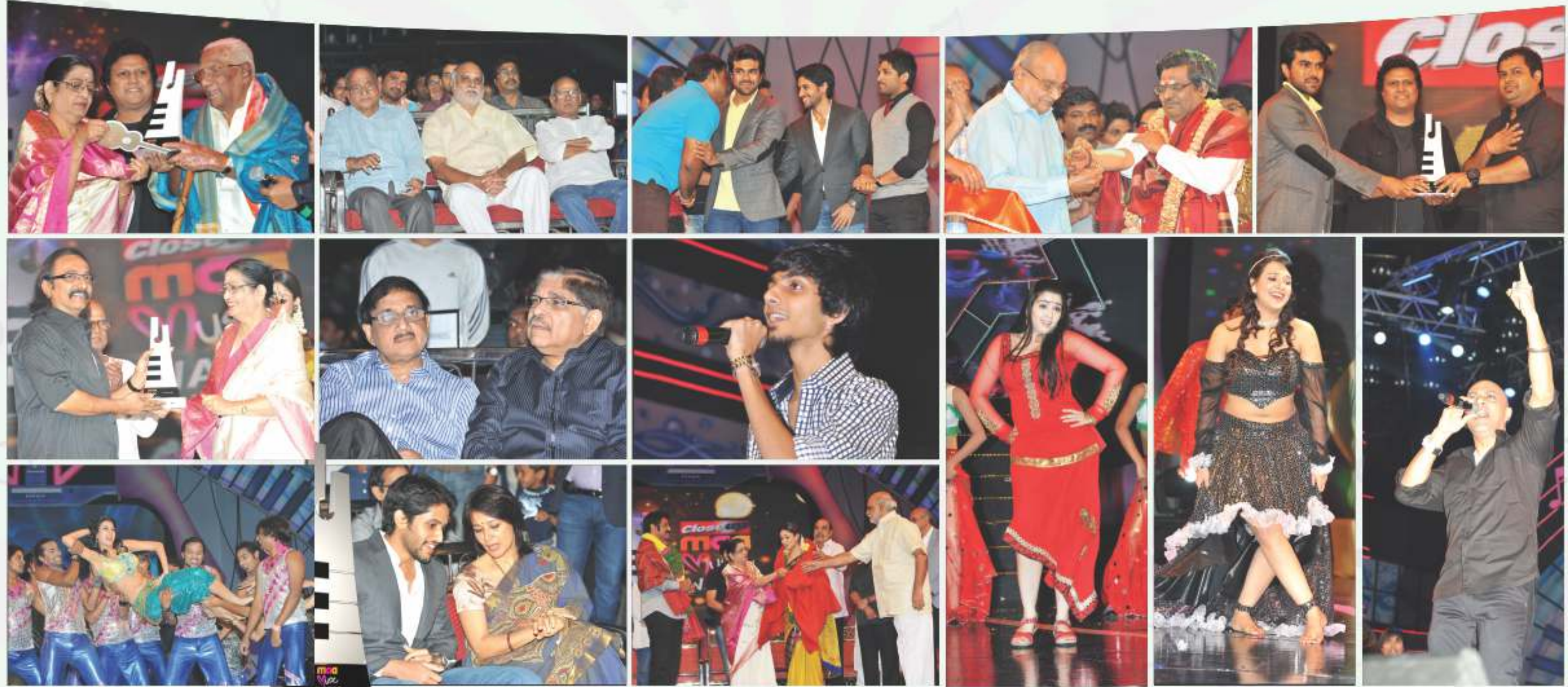
మా ఒకటి రెండుగా మారింది

ఆలోచించి పెట్టుకోవాల్సినంత అవసరం ఇప్పుడుమనకు కనిపిస్తోంది. పోటీ ఎంతగా పెరుగుతున్నా ఆదినుంచీ నమ్ముకున్న నాణ్యత సిద్ధాంతాన్ని తిక్రణశుద్ధిగా నమ్ముతున్న మాటివి విలక్షణ వినోదంతో మున్నుండుకు దూసుకుపోతోంది.వినోదాన్ని కొత్త మార్గంలోకి మళ్లించి, ప్రేక్షకుల్ని విశేషంగా ఆకర్షించిన ఛానెల్ 'మా ఒకటి రెండుగా మారి, రెండు నాలుగై అశేష అభిమానుల ఆశీస్సులతో తన స్థానాన్ని నిలుపుకుంటూ వస్తోంది.ఇప్పుడు మరో ముందడుగు వేసింది మా. ఇప్పటి వరకు సినిమా రంగంలోని వివిధ విభాగాల్లో విశేష ప్రతిభ కనపరచిన సాంకేతిక నిపుణులకు అవార్డులు ఇస్తోంది.ఇప్పుడు సంగీత పరంగా ప్రతిభావంతులైనవారికి అవార్డులివ్వడం ఆరంభించింది. మాటివి చరిత్రలో మరో విశేషం ఏమిటంటే - 24 క్యారెట్ల స్వచ్ఛమైన నాణ్యమైన వినోదాన్ని అందించే మా గోల్డ్ ఛానెల్ ముస్తాబవుతోంది. ఇవన్నీ మనం ఎంతగానో సంతోషించదగ్గవి. ఈ అభివృద్ధి ఇలాగే కొనసాగుతూఉండాలని మన ఇష్టదైవాల్ని కోరుకుంటూ, దానికి వ్యక్తిగతంగా ప్రతిఒక్కరం శక్తివంచన లేకుండా శ్రమిస్తామని ప్రతిజ్ఞ చేద్దాం. ఛానెల్ తో పాటు మనం కూడా విజేతలమవుదాం.