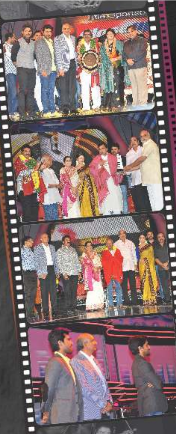
Maa Music Awards and Maa Gold Launch